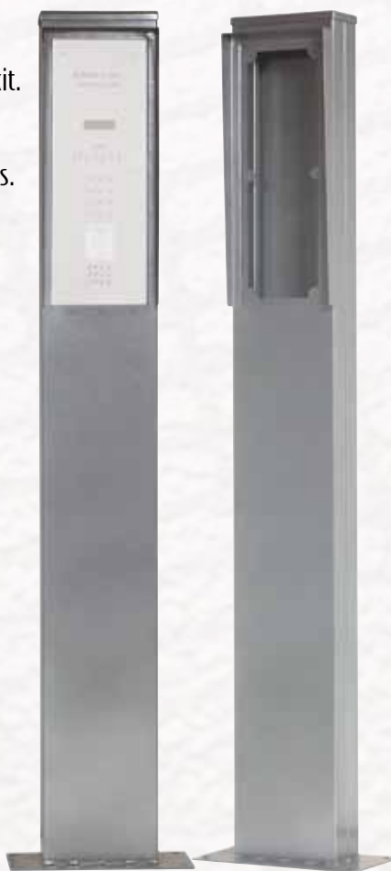
Réf. BORN 160