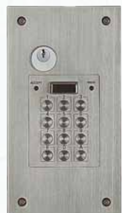
Réf. VX 5000 PTT avec T25