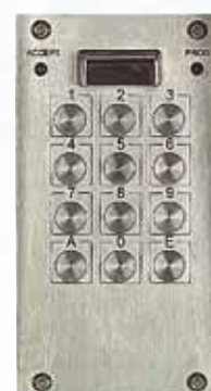
Réf. VX 4000-JE encastré