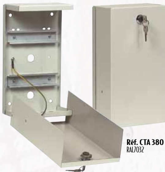
Réf. CTA 380 RAL7032