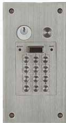
Réf. VX 5000 BPT avec bouton poussoir et T25