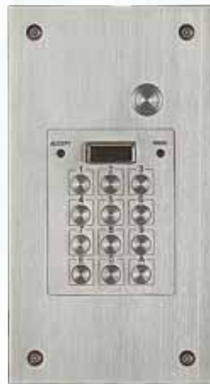
Réf. VX 5000 BP avec bouton poussoir

Clavier modulaire. Façade et boutons inox anti-vandales 60 codes sur 2 relais