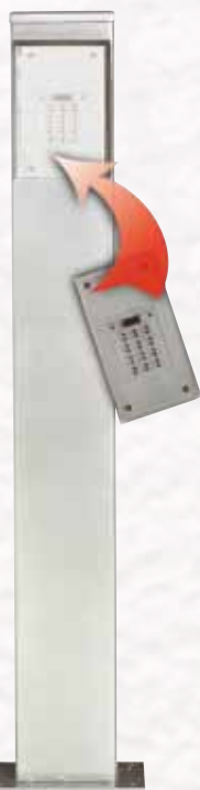
Réf. BORN 120

BORN 250 : ht. 2,50 m. pour voitures et camions.