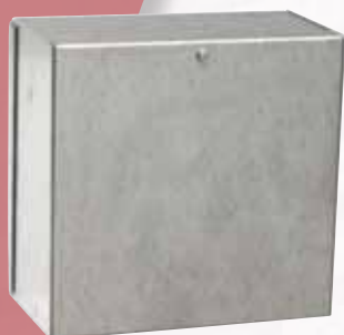
Réf. CTA 160 Finition galvanisé.

En tôle RAL 7032, possibilité finition galvanisé Fermeture à vis (Réf. CTA160) ou par clés (CTA300 / 380 / 420 et 600)