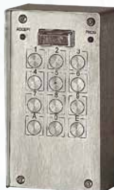
Réf. VX 4000-JS en saillie avec visière

Façade et boutons inox anti-vandales 60 codes sur 2 relais