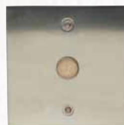
Réf. PL11PP Plaque inox percée (jusqu'au diam. 25 mm) Existe aussi en nu, avec bouton monté (T25 - NO/NF - BPAW diam. 20mm), avec antenne Vigik T25 ou encore avec support pour 1/2 canon enropéen.