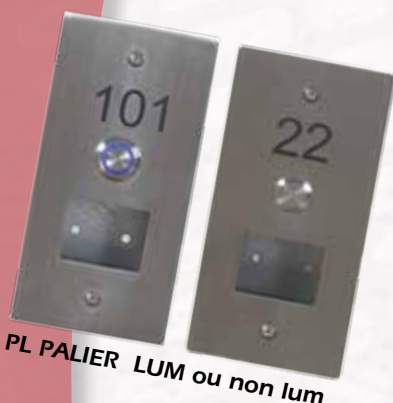
PL PALIER LUM ou non lum