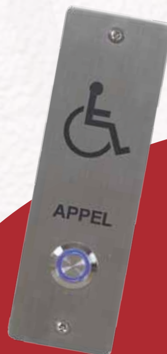
Appel hand LUM