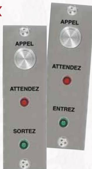
Réf. PL30SAS Jeu de plaques inox entrée/sortie avec voyant et BP pour sas (banque...)