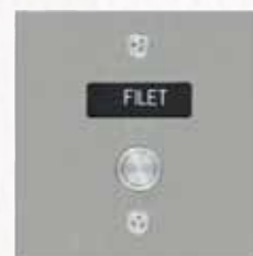
Réf. PLPALIER Plaque inox pour sonnerie avec BP et porte-nom.