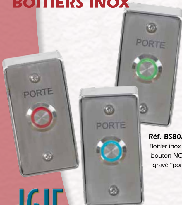
Réf. BS80/NFL Boitier inox en saillie avec bouton NO/NF lumineux gravé "porte".