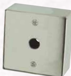
Réf. BS11BP Boitier saillie inox percé (jusqu'au diam. 25 mm). Existe aussi nu (sans perçage), avec T25, avec bouton NO/NF, avec bouton AW diam. 20 mm ou 25 mm, avec antenne VIGIK T25.