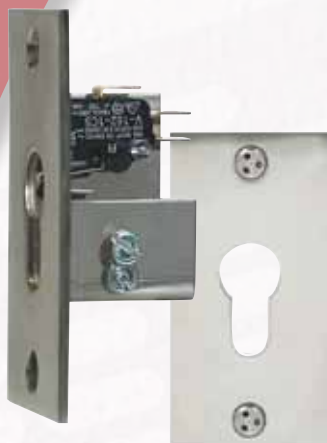
Réf. SUPEURO Plaque inox pour 1/2 canon europ et contact.